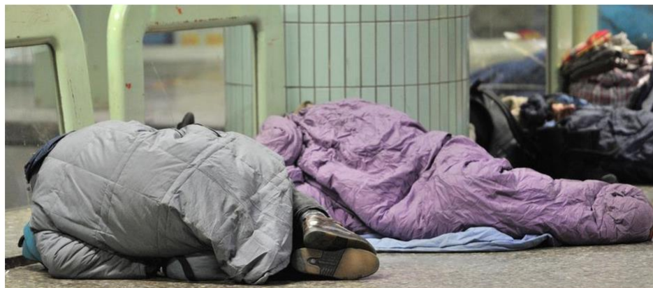
Obdachlose in Frankfurt können im S-Bahnhof Hauptwache übernachten.

Wie kann die Hilfe für wohnsitzlose Menschen trotz der Corona-Pandemie aufrechterhalten werden? Kommunen und Träger in Hessen suchen derzeit nach Lösungen.